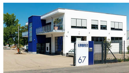
Unser Firmensitz in der Bonner Maarstraße

Mitarbeiter und Geschäftsleitung arbeiten bei ETS-Technik an einem gemeinsamen Ziel: Wir haben den Anspruch, täglich mit Spaß an der Arbeit den Anforderungen unserer Kunden gerecht zu werden.